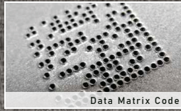
Data Matrix Code